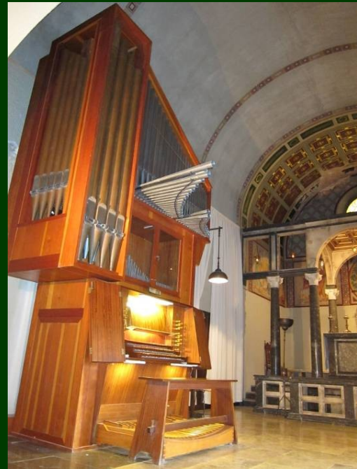
Blancafort-Capella (1971) Capella de Sant Fructuós