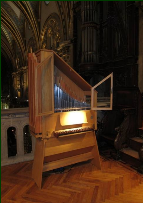
Blancafort-Capella (1972) Cor superior de la Basílica

Orgues d'estudi disponibles/Órganos de estudio disponibles: